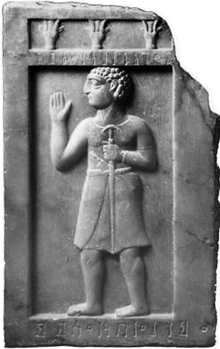
Vele inwoners van zuidelijk Arabië waren afkomstig uit Aksum (Ethiopië, Afrika). Afbeelding van een man met gekruld haar uit de Mahram Bilqis tempel

De oudste verwijzing naar deze Arabieren is te vinden in het Bijbelse boek Genesis waar Arabische handelaars Jozef, de oudste zoon van Jacob, kochten en verkochten. Andere verwijzingen naar Aribi kunnen gevonden worden in documenten van de Assyrische koningen. Nadien werden de Arabieren onderworpen aan het gezag van de Babylonische koning Nabonidus die zijn hoofdstad vestigde op de oase van Temâ.