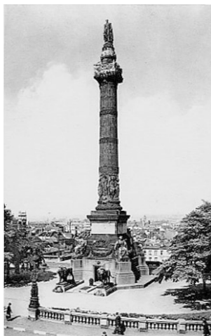
De Congresskolom te Brussel, ingehuldigd in 1859, architect Joseph Poelaert

Er bestaat ook een satirische medaille uit 1831 op naam van Surlet de Chokier. Wie deze heeft laten maken is niet bekend. Op de voorzijde staat “de Goede Herder” met zijn schapen, een allusie op hem als fokker van merinosschapen. De keerzijde vermeldt het pensioen van 10.000 gulden per jaar dat hij kreeg voor zijn diensten: een vorstelijk bedrag voor die tijd. Het bedrag is in gulden omdat de Belgische frank slechts in 1832 ingevoerd werd.