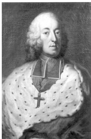
Johan-Theodoor van Beieren, prins-bisschop van Luik (1744-1763), schilderij van Paul-Joseph Delcloche