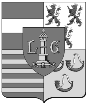
Wapenschild van het prinsbisdom Luik, met de schilden van: Bouillon Franchimont Luik Loon Hoorn

De prins-bisschoppen zochten dan ook vanaf de 16 de eeuw hun toevlucht in een politiek van neutraliteit; bij een oorlog tussen de buurlanden (dus vrijwel steeds) trokken deze zich van die neutraliteit echter niets aan en doorkruisten met hun legers het land precies of het van hen was. Toch had het complex karakter van dit vorstendom ook zijn voordelen. Hoegaarden bvb. behoorde tot Luik, maar was volkomen ingesloten door Brabant; vermits de bieraccijns in Luik véél lager was dan in Brabant konden de brouwers er veel goedkoper de omliggende (Brabantse) dorpen bevoorraden dan de Brabantse concurrenten. Zo ongeveer ieder huis in Hoegaarden herbergde dan ook een brouwerij of stokerij.